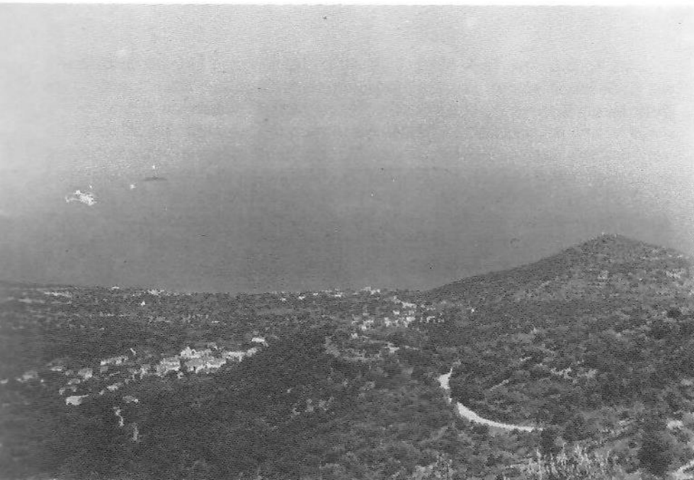
Τα Πούλιθρα και η Βίγλα

(αφιερωμένης στη Γέννηση του Χριστού) βρέθηκαν από κάτω ίχνη φωτιάς και καμμένη ξυλεία.